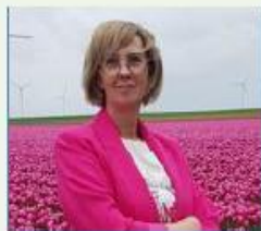
Coördinator bij Hospice Zwolle en rouwbegeleider

Ze was zeven jaar mantelzorgster voor haar moeder die vorig jaar overleed aan dementie.