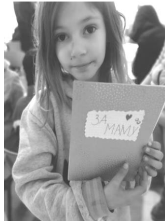
bijles voor schoolkind