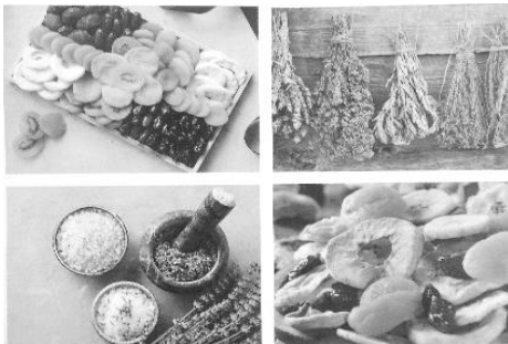
Droogmachine in gebruik genomen

Ook dorpelingen maken daar gebruik van, wat extra geld in het laatje brengt. Er zijn plannen om een schuurtje voor deze machine te bouwen.